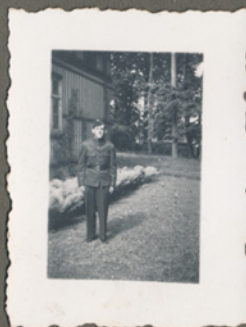
Leo som CBU'er på Bernstorff Slot i Gentoft juni, 1941 (Negativfilm 9, nr. 27)