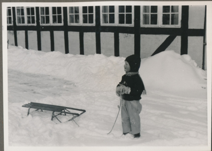
Negativfilm 39, nr. 13-14

Conni på Troelsegård i begyndelsen af 1963 (Troelsevej 165, 5491 Blommenslyst)