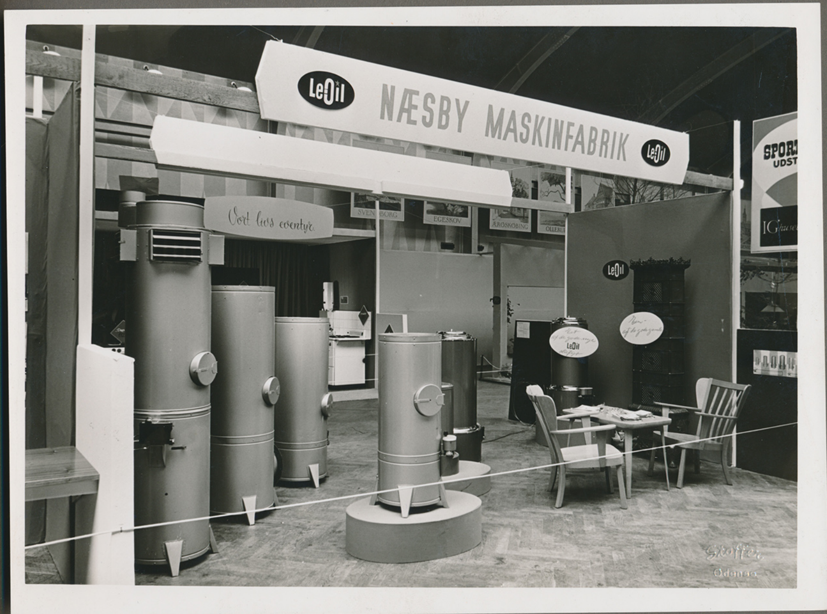
Næsby Maskinfabriks stand på en udstilling ca. 1955