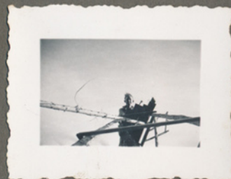
Leo - opstilling af vindgenerator (vindmølle der kan lave strøm) i Nyborg, 1942