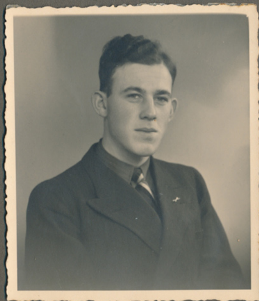
Leo omkring 1938