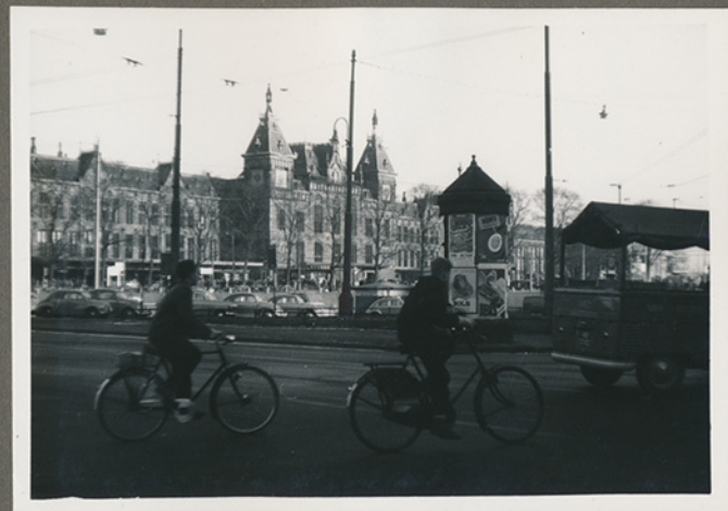
(Negativfilm 6, nr. 11)