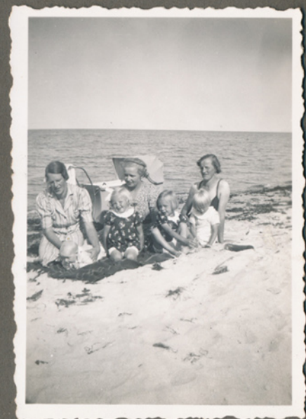
Magna sidder i midten, stranden nær Carlsminde ved Bovense, 1940