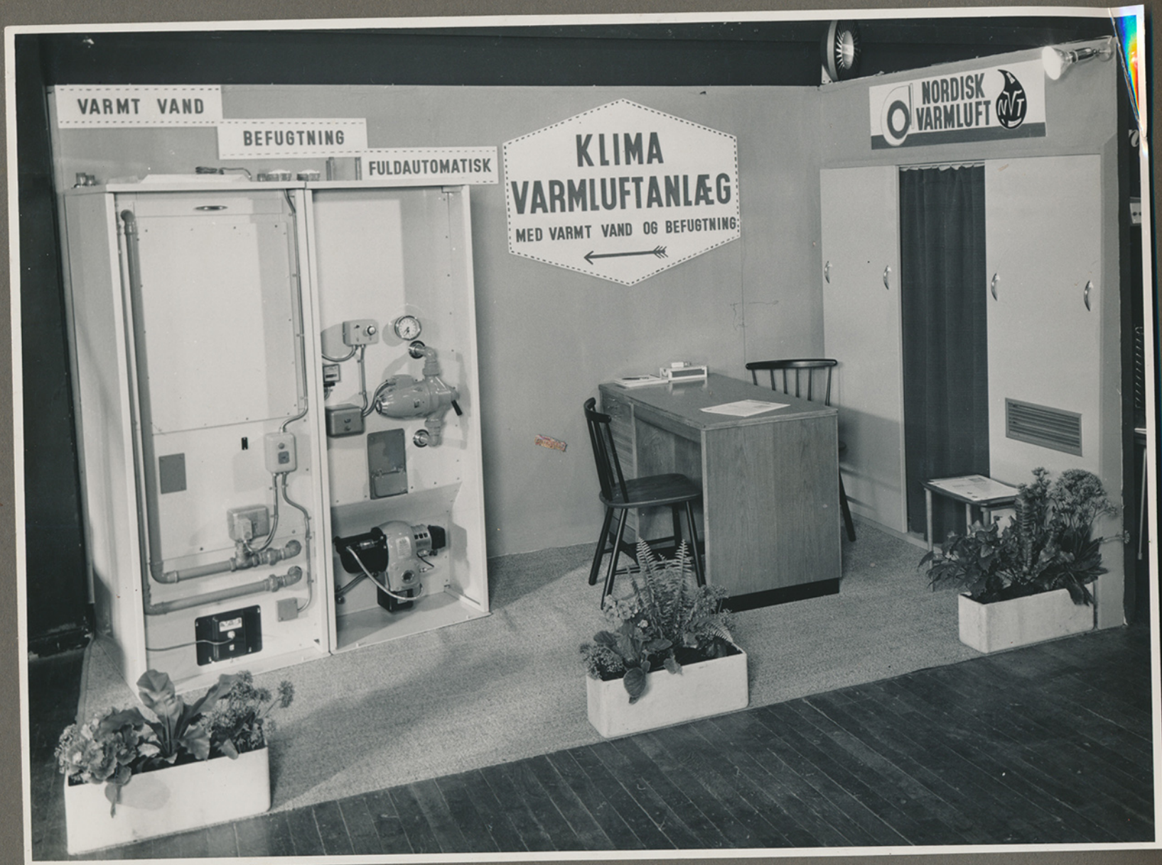
Stand med klimaanlæg fra Nordisk Varmluft ca. 1962