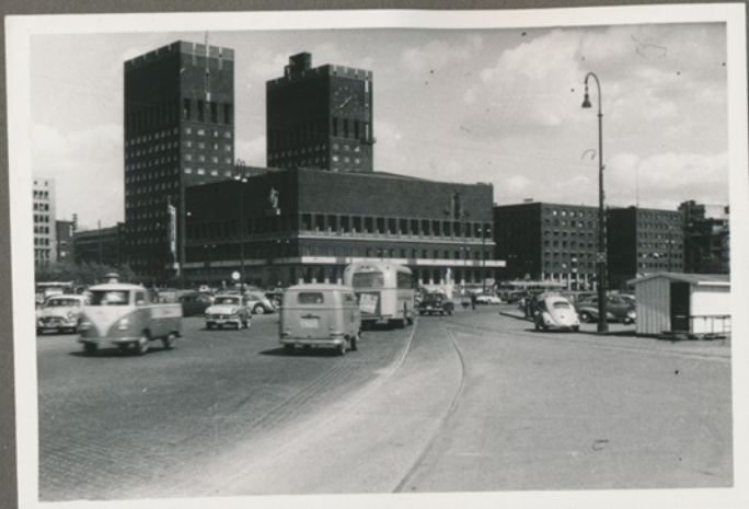
Oslo Rådhus, forretningsrejse i forbindelse med Landsudstillingen i Oslo, i maj 1957 (Negativfilm 6, nr. 34)