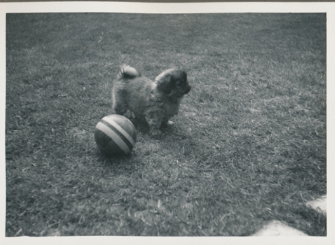
En af vores hund Bibis hvalpe på Lisevej i Næsby, 1957 (Negativfilm 6, nr. 31)