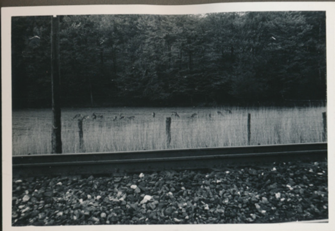
Rådyr nær jernbane 1957 (Negativfilm 6, nr. 30)