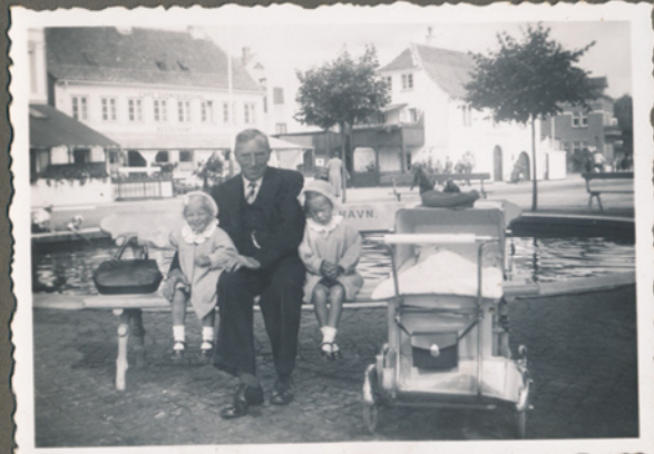
Ukendte personer. I baggrunden restaurant Svendborgsund ved havnen i Svendborg, måske 1941. Samme person på side 10?