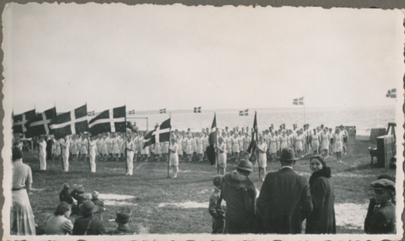
Gymnastikstævne ved vandet, måske 1939