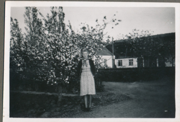
Magna måske i nærheden af Carlslund hvor hun tjente i 1940