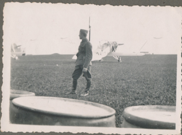
Soldat ved flyveplads måske 1940