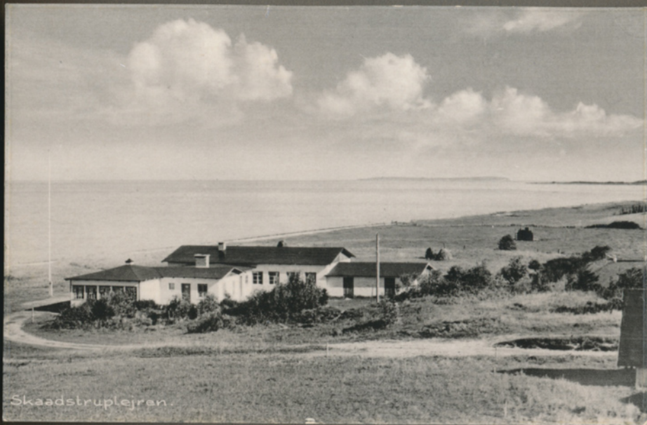
Skåstruplejren på Nordfyn hvor Leif var på lejrskole i 3. klasse med Næsby Skole, 1956. Jeg brugte vist de fleste lommepege til dette kort og til at blive fotograferet