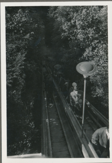
Munkebjerg ved Vejle 1957 (Negativfilm 6 nr. 23)