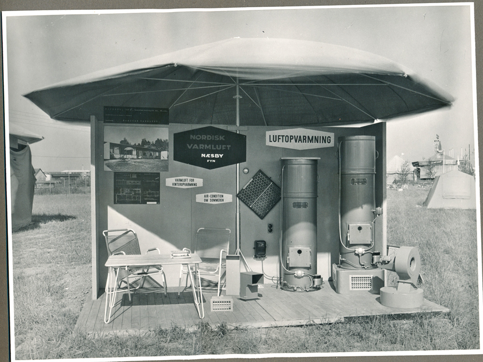
Stand med luftvarmeprodukter fra Nordisk Varmluft ca. 1959