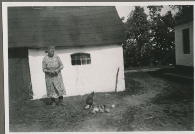
Magnas mor Agnes med høne og kyllinger, Krogstrup måske omkring 1940.