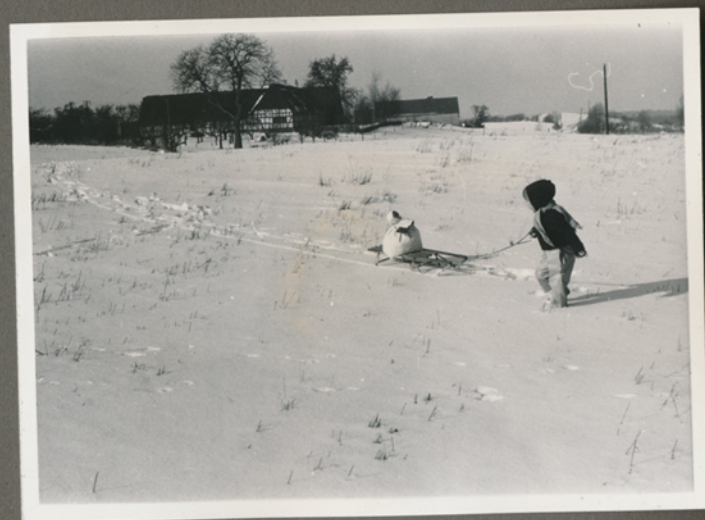
Negativfilm 39, nr. 27-28