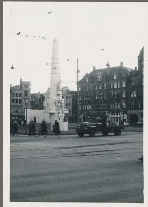
(Negativfilm 6, nr. 13)

Billeder fra en forretningsrejse til Hamborg ca. april 1957