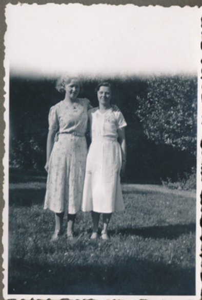
Magna til venstre