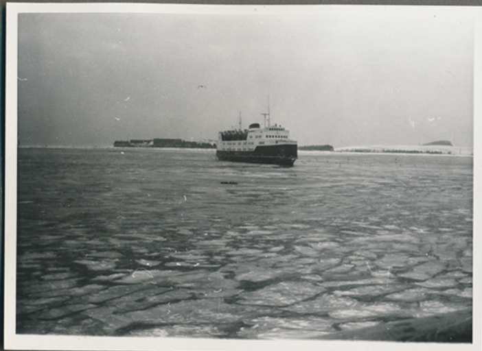
Sandsynligvis Storebælt isvinteren 1963 (Negativfilm 39, nr. 25-26)