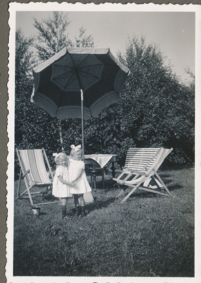
Ukendte personer måske 1941