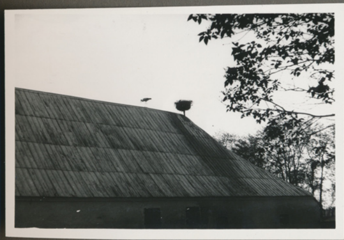
Stork og storkerede 1957 (Negativfilm 6, nr. 25)