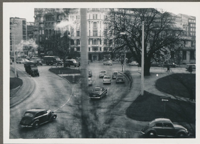
(Negativfilm 6, nr. 7)

Billeder fra en forretningsrejse til Hamborg ca. april 1957