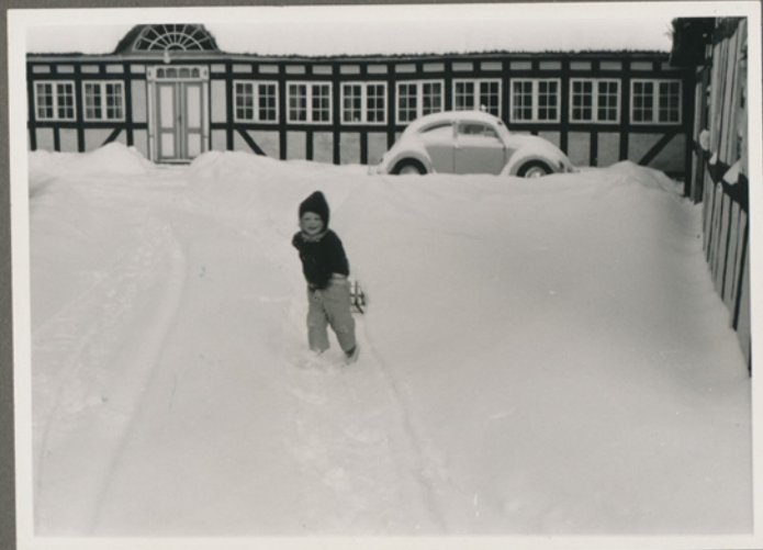
Negativfilm 39, nr. 15-16

Conni på Troelsegård i begyndelsen af 1963 (Troelsevej 165, 5491 Blommenslyst)