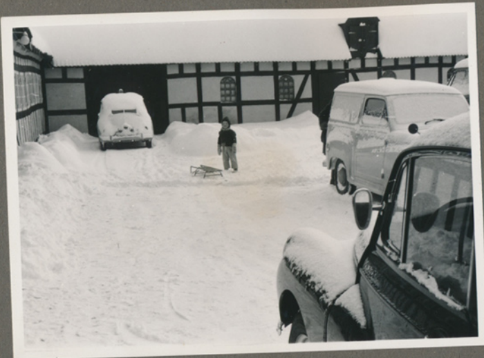
Negativfilm 39, nr. 11-12