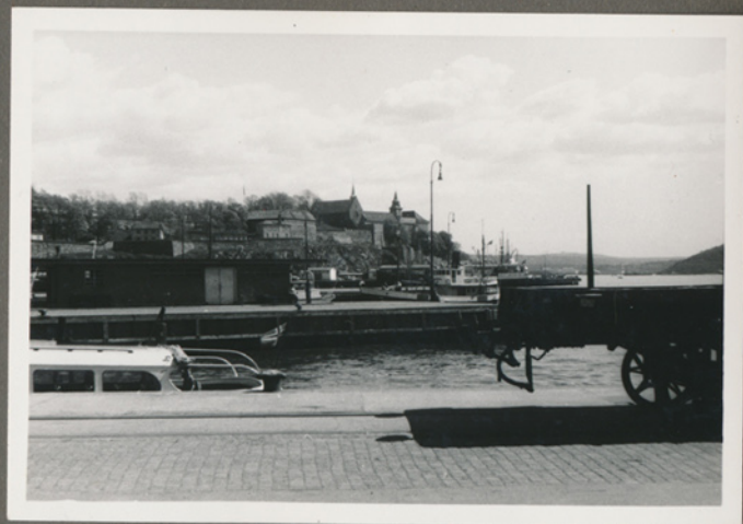
Oslo havn, forretningsrejse i forbindelse med Landsudstillingen i Oslo, i maj 1957 (Negativfilm 6, nr. 35)