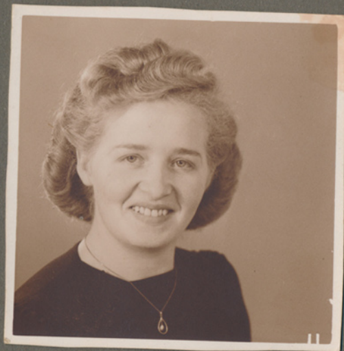
Magna måske omkring 1950. Et billede af mange (nr. 11) taget hos en fotograf.