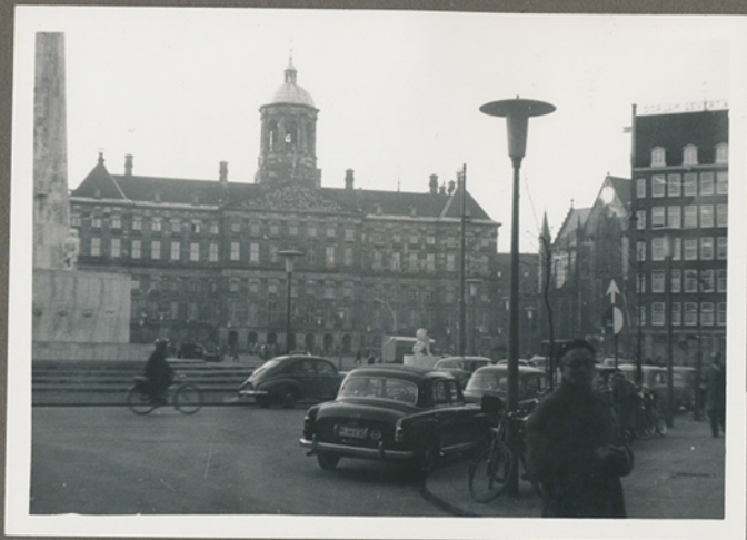
(Negativfilm 6, nr. 14)