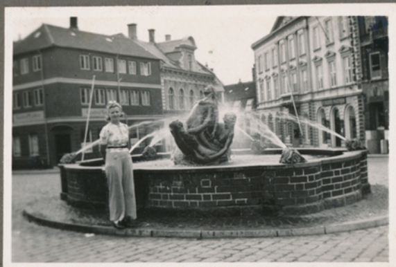
Magna ved Havfruefontænen i Svendborg, måske 1940